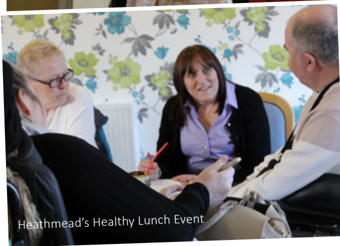
Heathmead's Healthy Lunch Event