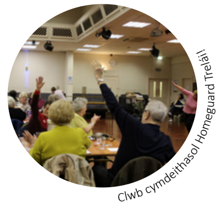
Clwb cymdeithasol Homeguard Trelái!

cynllun ynglŷn â digwyddiadau sydd ar ddod, neu ffoniwch Cyfranogiad Tenantiaid ar 029 2087 1777 .