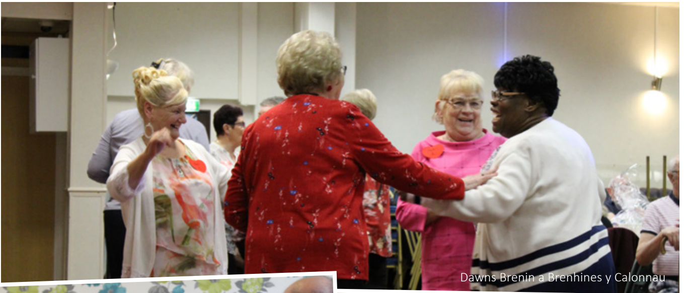
Dawns Brenin a Brenhines y Calonnau